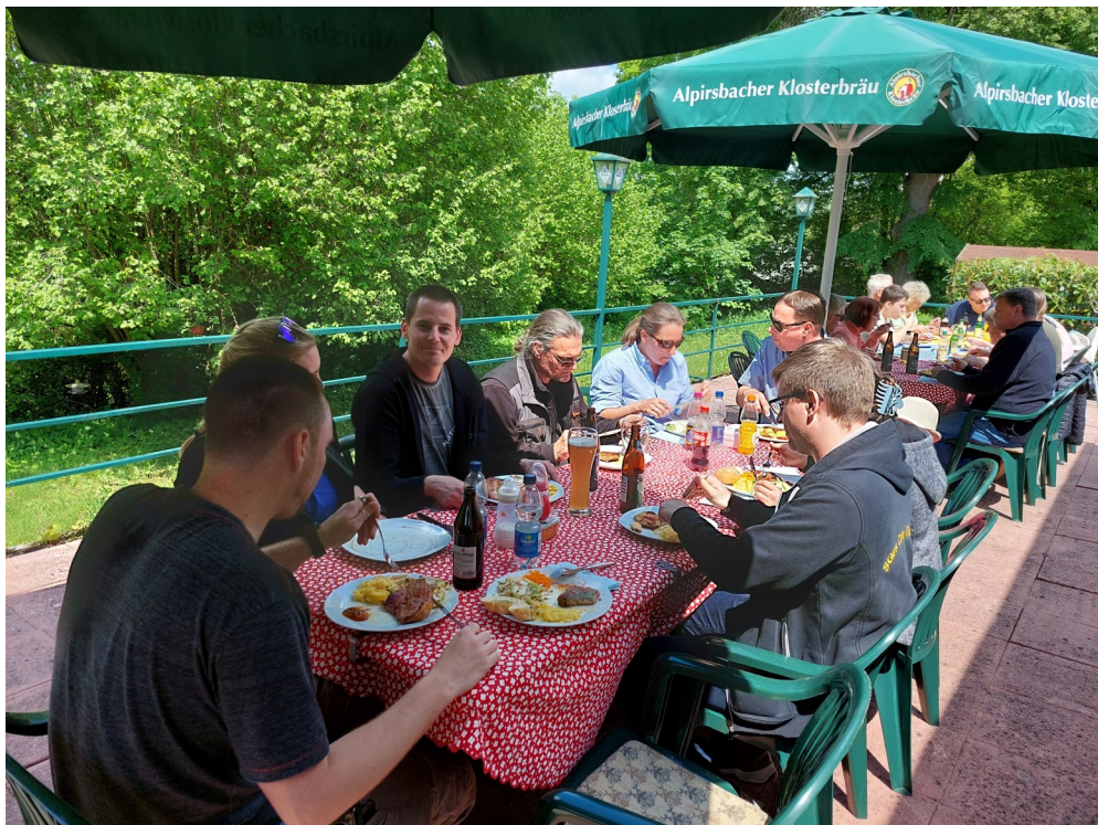
Vatertagsgrillen am 09. Mai 2024